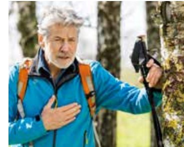
In der Freizeit