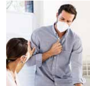
Auf der Arbeit